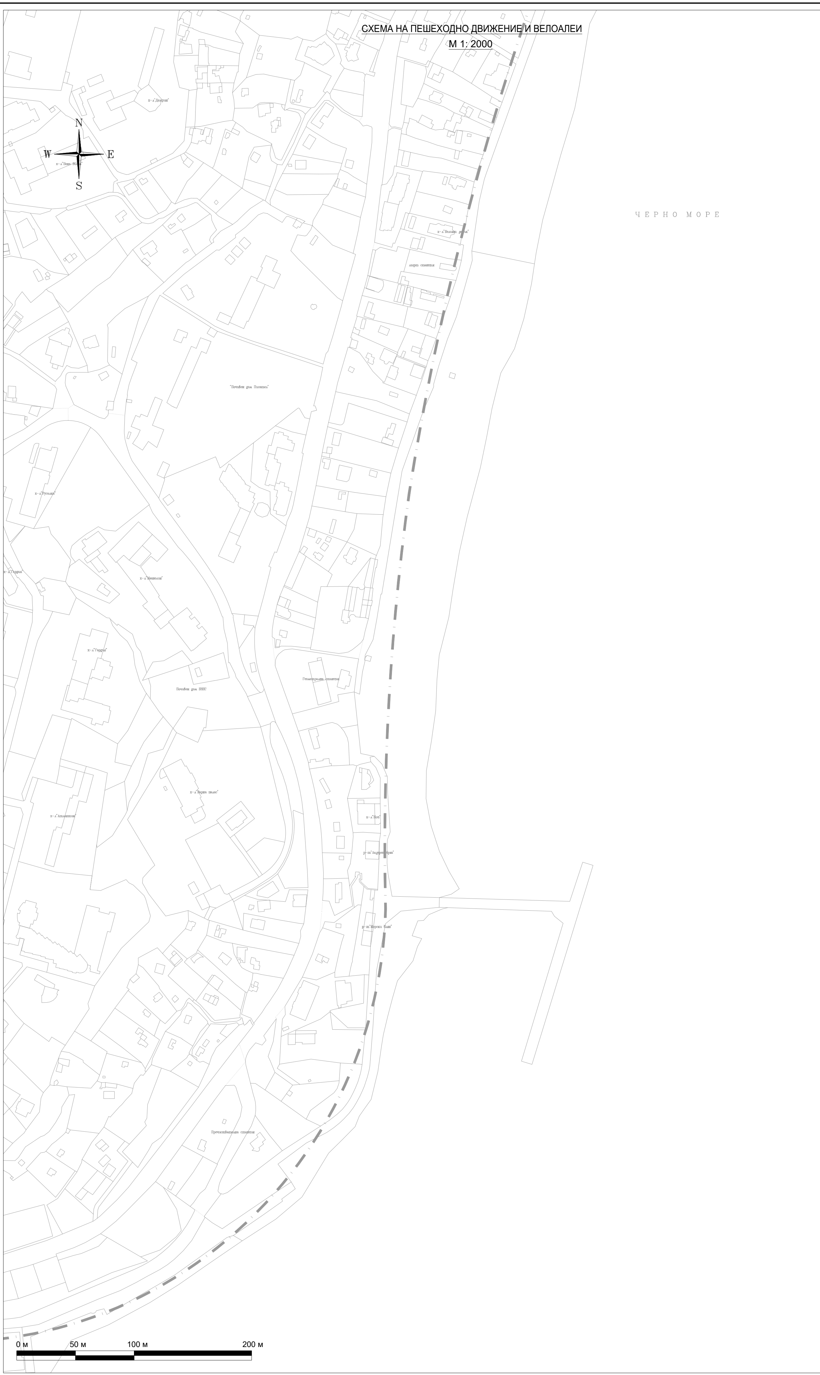
СХЕМА НА ПЕШЕХОДНО ДВИЖЕНИЕ И ВЕЛОАЛЕИ М 1: 2000