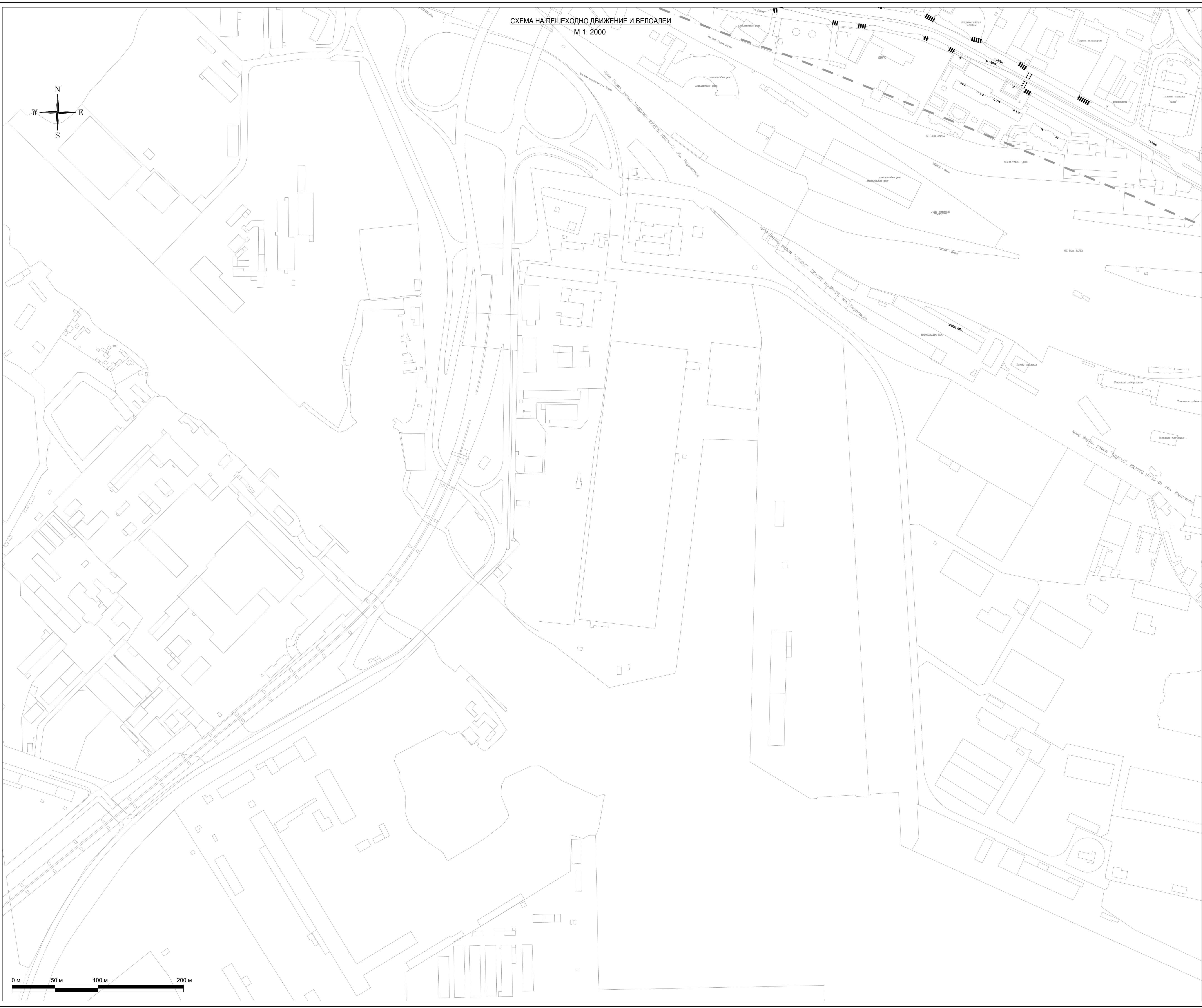
СХЕМА НА ПЕШЕХОДНО ДВИЖЕНИЕ И ВЕЛОПЕИ М 1: 2000