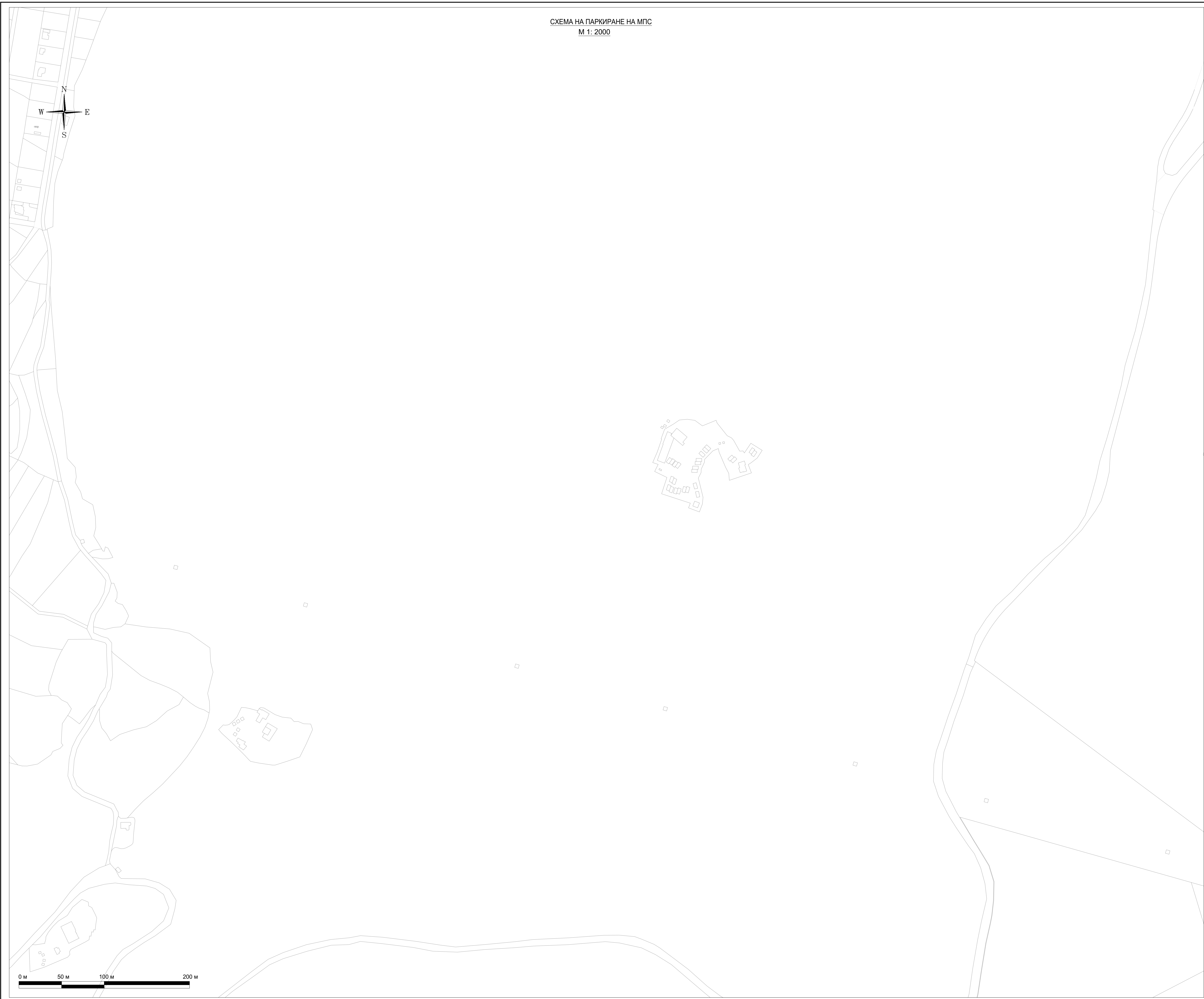
СХЕМА НА ПАРКИРАНЕ НА МПС М 1: 2000