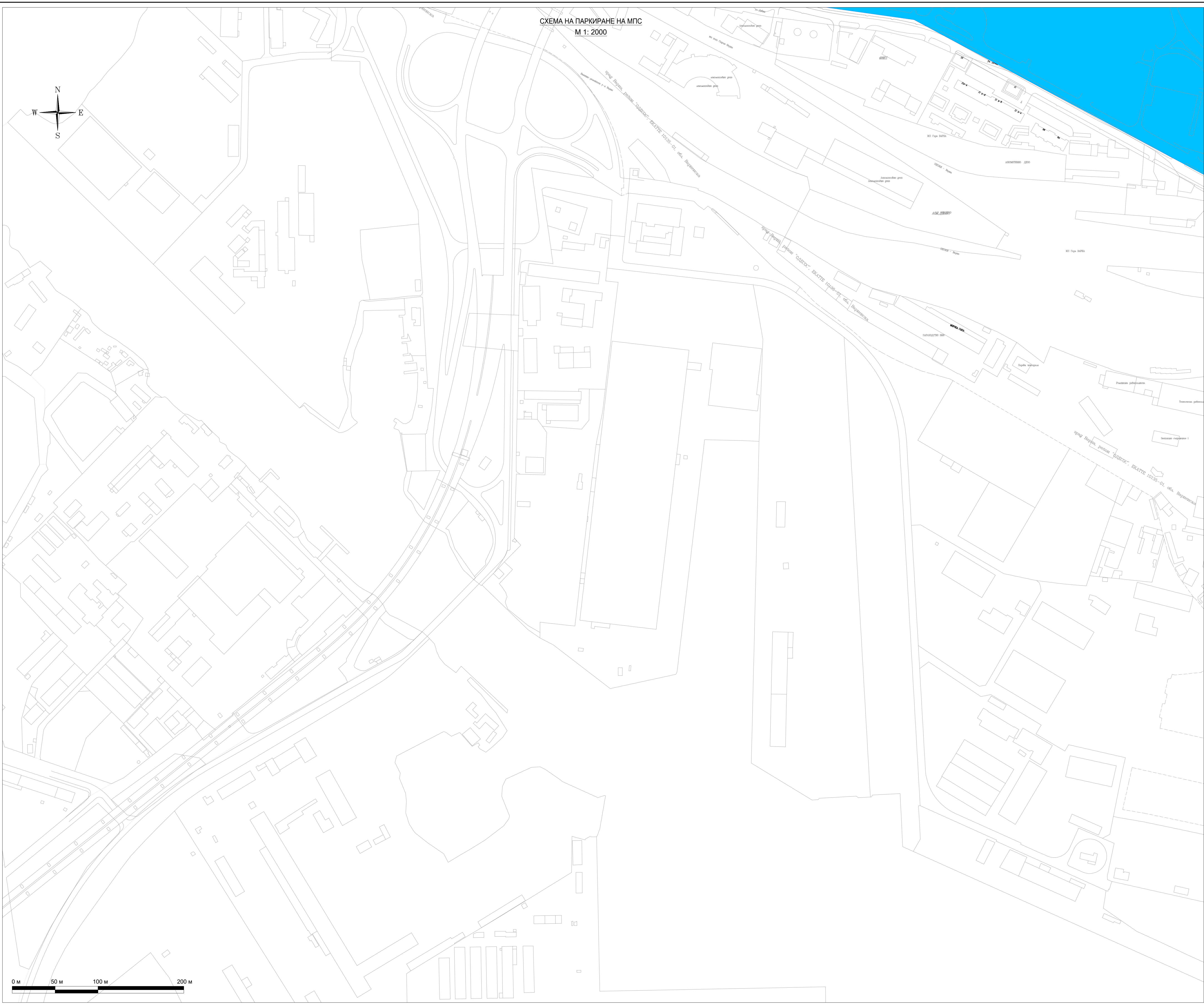
СХЕМА НА ПАРКИРАНЕ НА МПС М 1: 2000