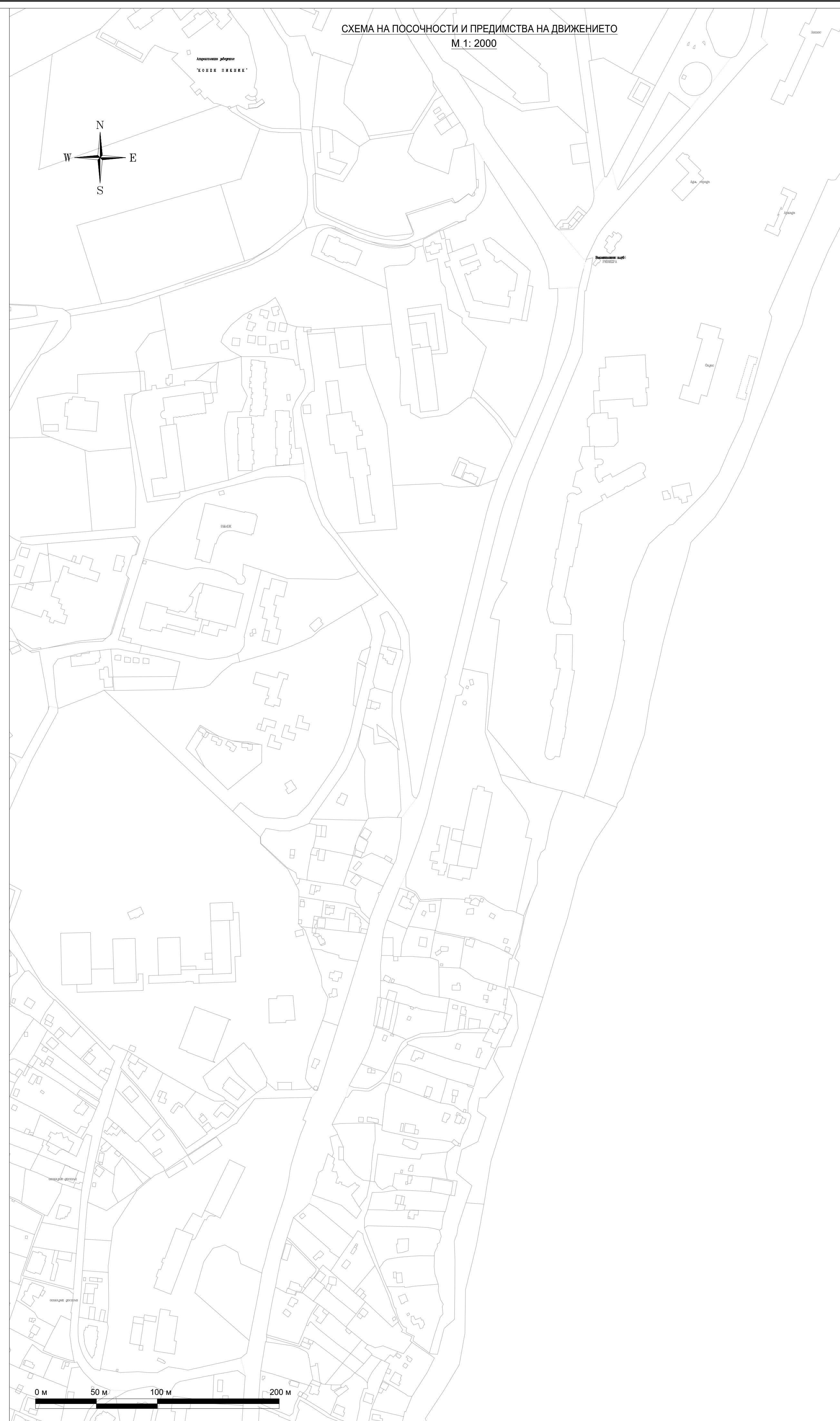
СХЕМА НА ПОСОЧНОСТИ И ПРЕДИМСТВА НА ДВИЖЕНИЕТО М 1: 2000