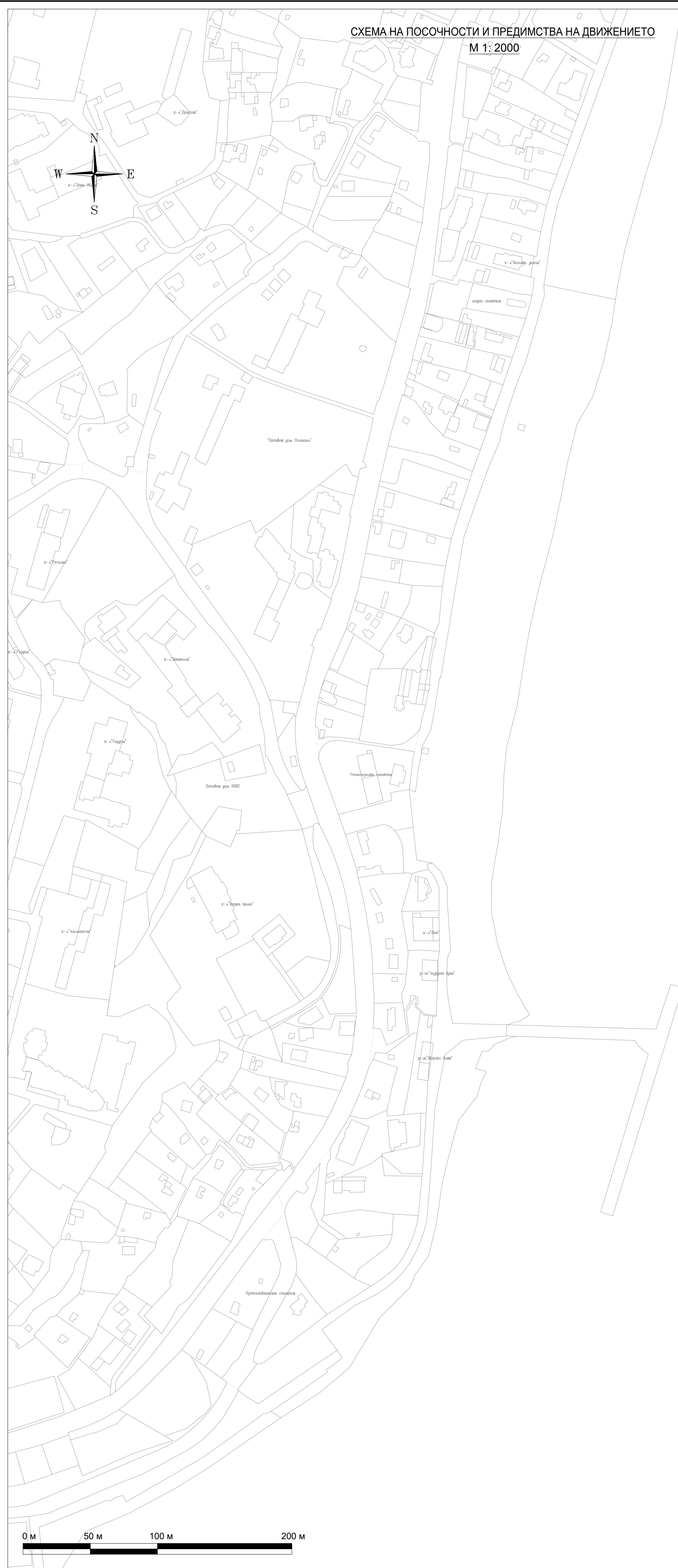
СХЕМА НА ПОСОЧНОСТИ И ПРЕДИМСТВА НА ДВИЖЕНИЕТО М 1: 2000