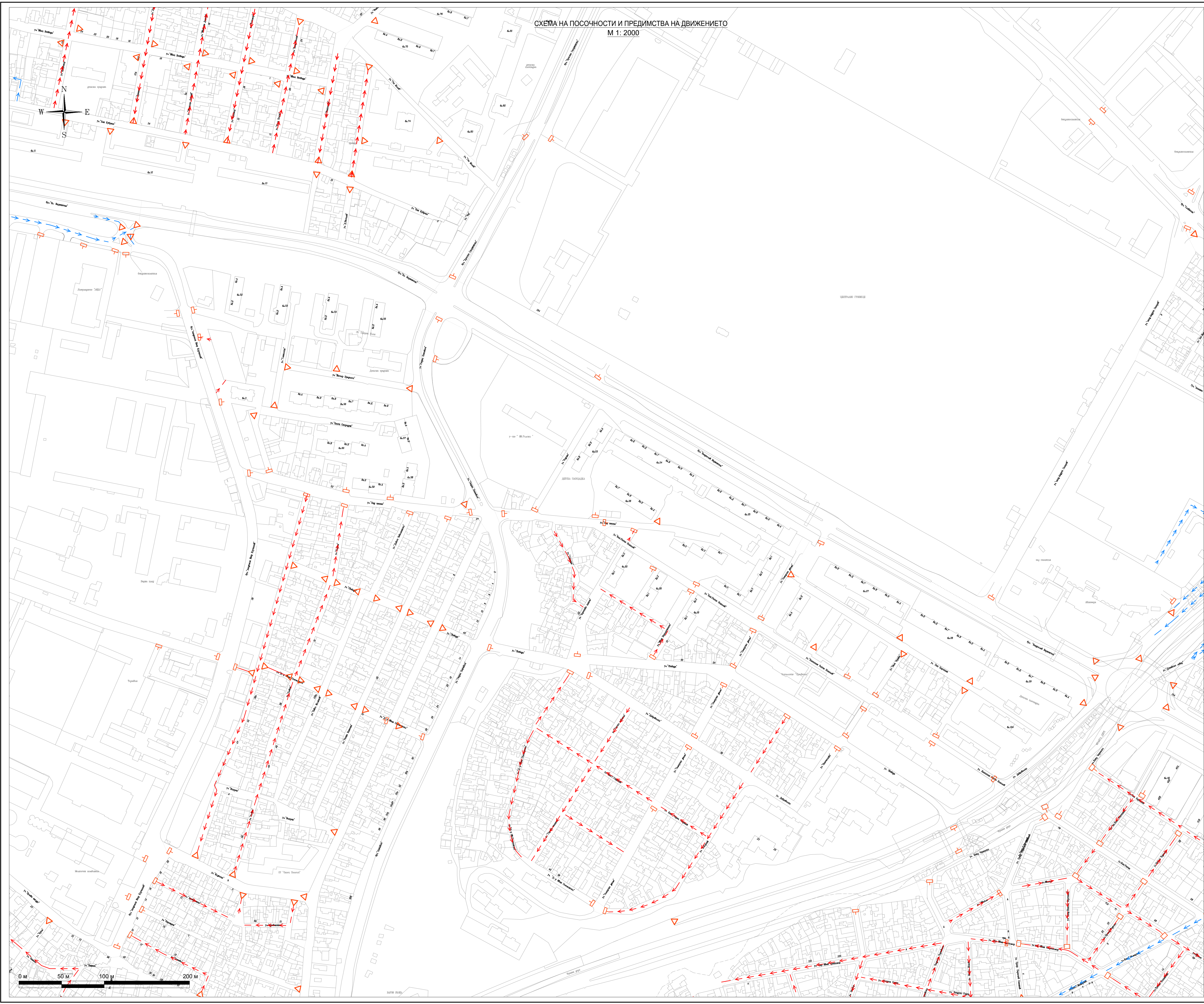
СХЕМА НА ПОСОЧНОСТИ И ПРЕДИМСТВА НА ДВИЖЕНИЕТО М 1: 2000