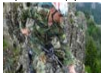
ФУНКЦИЯ „ОТБРАНА И СИГУРНОСТ“

Отчетът на капиталовите разходи към 30.06.2015 г. е в размер на 110 798 лв., в т.ч.: за основен ремонт на сградата на Кметство Казашко – 29 650 лв., компютърно и офис оборудване – 31 594 лв., програмни продукти – 49 554 лв.