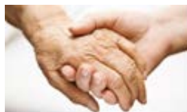
ФУНКЦИЯ „СОЦИАЛНО ОСИГУРЯВАНЕ, ПОДПОМАГАНЕ И ГРИЖИ“

Към 30.06.2015 г. обектите, отнасящи се за преустройство, проектиране и изграждане на пристройки в детски ясли не са възложени. Очаква се да бъдат изпълнени през III-то и IV-то тримесечие.