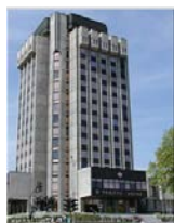
ФУНКЦИЯ „ОБЩИ ДЪРЖАВНИ СЛУЖБИ“

Отчетените разходи към 30.06.2015 г. във функцията възлизат на 5 921 428 лв. Запазва се тенденцията от предходните години за намаляване на разходите за издръжка на общинската администрация във функцията „Общи държавни служби“ - в сравнение със същия период на 2014 г., разходите за издръжка на общинската администрация са намалели с 393 884 лв.